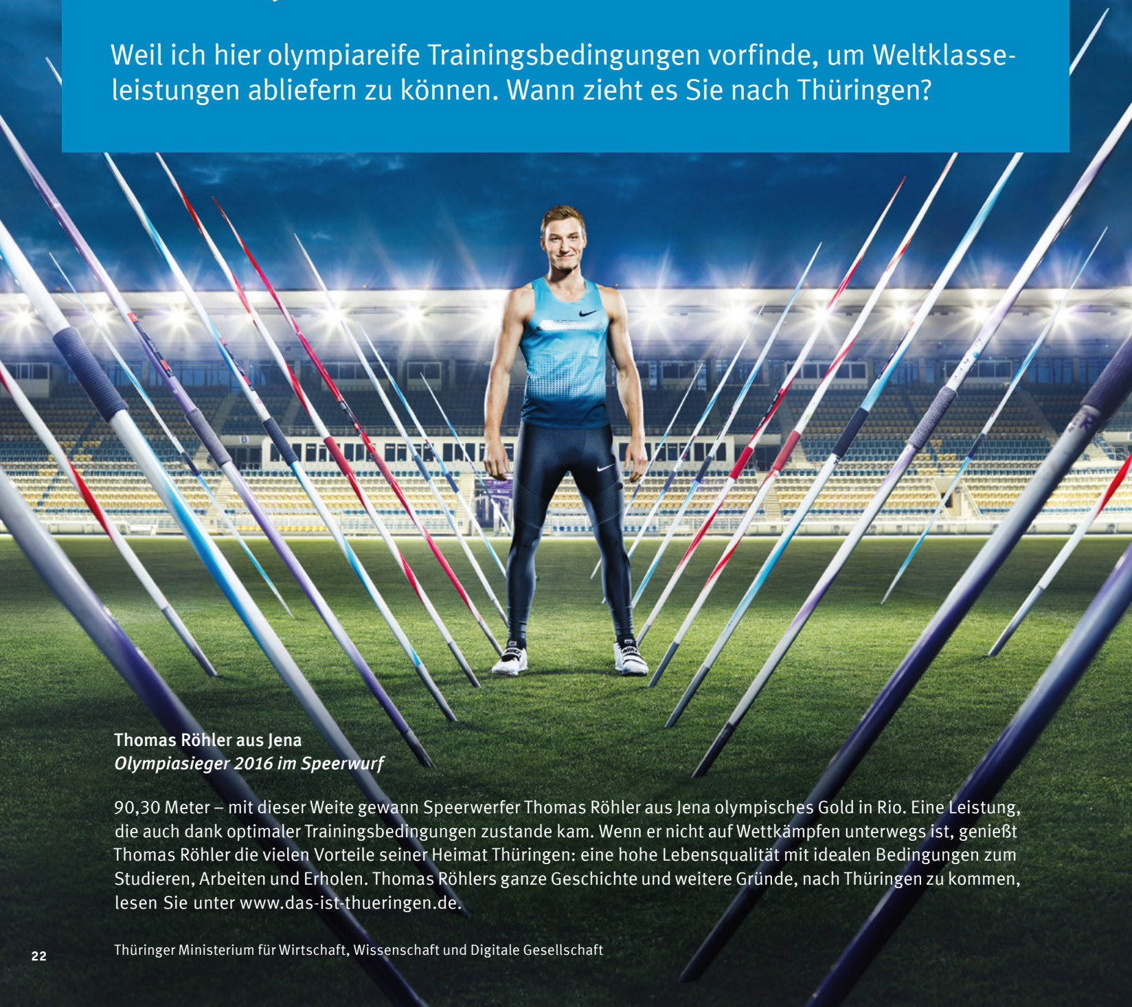
Thomas Röhler aus Jena Olympiasieger 2016 im Speerwurf

Weil ich hier olympiareife Trainingsbedingungen vorfinde, um Weltklasseleistungen abliefern zu können. Wann zieht es Sie nach Thüringen?