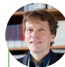
Prof. Dr. Hartmut Rosa Soziologe & Buchautor

Die ganze Story gibt es unter www.visit-jena.de/Olaf_Schubert zu lesen.